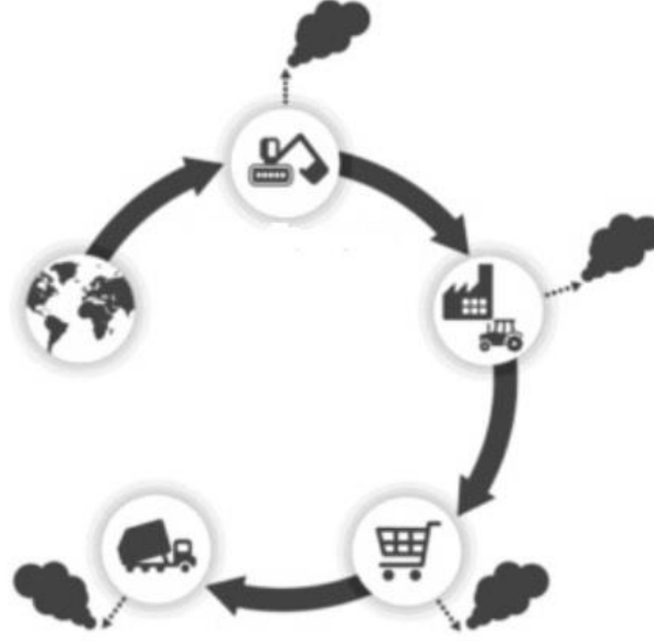
Şekil 1: Doğrusal Ekonomik Yaklaşım.

olarak isimlendirilmektedir. Doğrusal ekonominin işleyişini Şekil 1’de daha iyi görmek mümkündür.