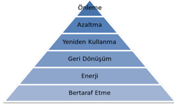
Şekil 3: Atık Yönetimi Amaç Hiyerarşisi

mümkündür. Şekil 3'te yer alan atık yönetiminin, amaç hiyerarşisinde en tepede önleme yer almaktadır. Daha sonra sırası ile azaltma, yeniden kullanma, geri dönüşüm enerji ve bertaraf etme şeklinde sıralanmaktadır.