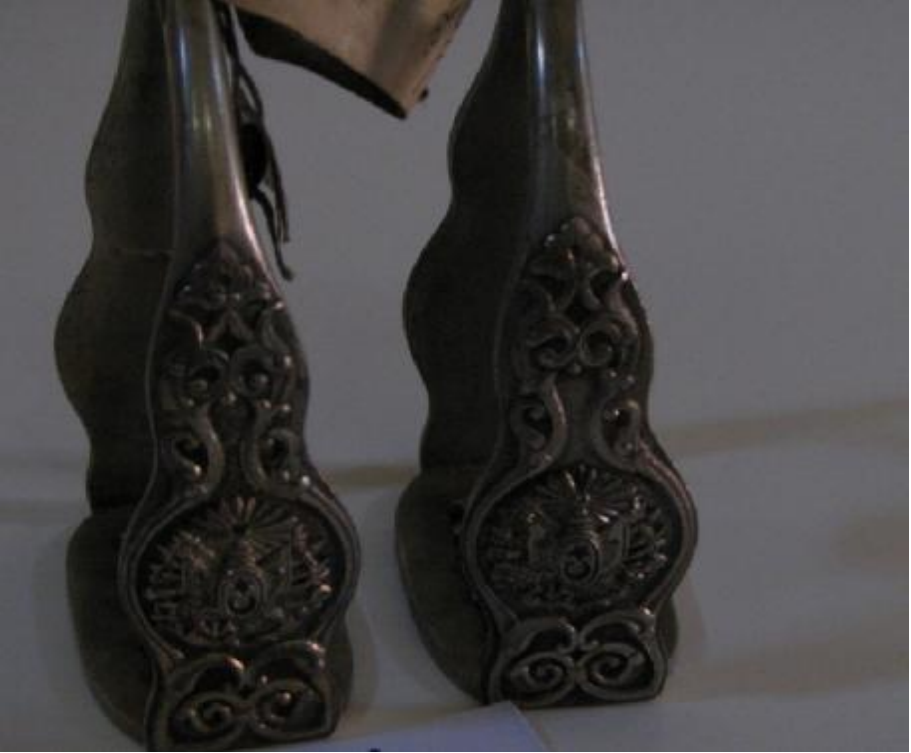
Resim 1. Üzengi.

Kaynak: Topkapı Sarayı Müzesi, Envanter numarası: 36/251.